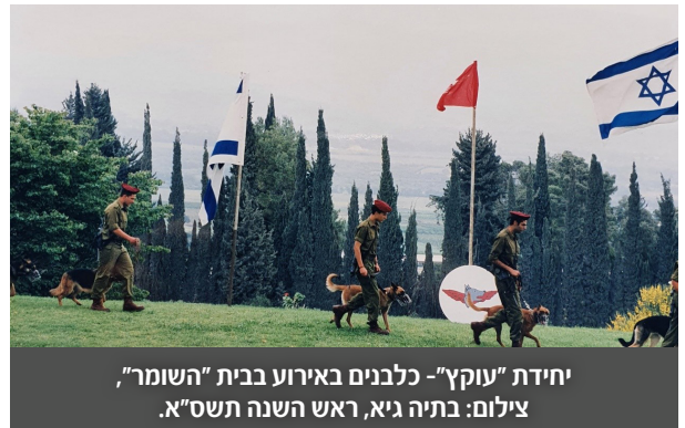
יחידת "עוקץ" - כלבים באירוע בבית "השומר", ראש השנה תשס"א.