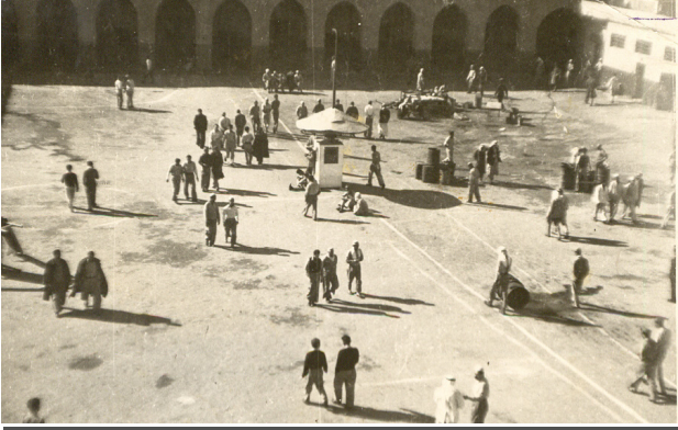
חצר בית הכלא בעכו.

ככל שגבר המתח בארץ בעקבות המלחמה ההולכת ומחריפה, כך גבר רצונם של האסירים בבית הכלא המרכזי בירושלים לברוח מן הכלא ולעזור לחבריהם הלוחמים בחוץ. ביומנו מייטיב שרגא לתאר תחושות אלה: "מצב רוחנו אנו לא היה מרומם ביותר עקב המצב בחוץ, והקורבנות הנפלים מדי שעה בשעה." (שם, שם)