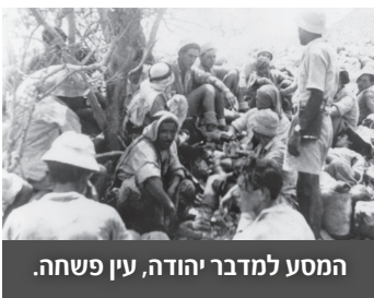
המסע למדבר יהודה, עין פשחה.