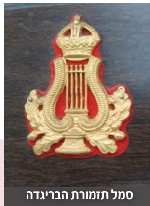
סמל תזמורת הבריגדה

לאור המחמאות שהגיעו מכל היחידות הוחלט במפקדת הבסיס כי הרמה שלנו מצדיקה הכרה רשמית בתזמורת. כתוצאה מזה צורף לכל אחד מהנגנים התואר SMSM "באנדסמן", כלומר איש תזמורת, והסמל הרשמי של תזמורת צבאית - נבל מעוטר ומעליו הכתר המלכותי. הפרטואר שלנו התעשר במארשים וגם במוזיקה קלה.