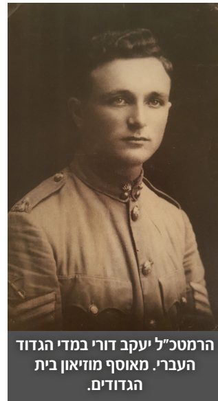
הרמטכ"ל יעקב דורי במדי הגדוד העברי.

"...הגדודים העבריים הורישו ל"הגנה" סגל נכבד של הנהגה, פיקוד והדרכה, אשר עיצב את דמותה, חינך את שורותיה למשמעת לאומית וצבאית, הדריך את חבריה בלוחמה ובידע צבאי והביא אותה בסוף הדרך לשמש הלוחם שממנו צמח ועלה צבא ההגנה לישראל."