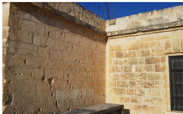
סימני ירי על קירות מבנה בית הסוהר.

לקראת סוף השלטון הבריטי בארץ ישראל החלו האסירים היהודים בכלא ירושלים לחוש מאוימים גם מבפנים וגם בחוץ - משום שהבינו כי העמדות הערביות נמצאות במרחק לא רב מבניין הכלא.