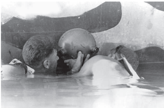
הנחת מוקש עלוקה במהלך אימון. מאוסף המוזיאון.

(יוס'ה דרור, מתוך "הקומנדו הימי ממנו ואליו").