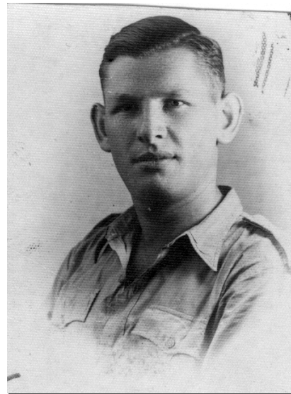
איתן לבני, מפקד המבצעים של האצ"ל ומג"ד ראשון של גדוד 57 של האצ"ל בחטיבת "גבעתי" במלחמת העצמאות.

איתן לבני היה מפקד המבצעים הראשי של האצ"ל מיום תחילת המרד ב-1 בפברואר 1944, ועם הקמת המדינה והצטרפות חיילי האצ"ל לצה"ל נתמנה למפקד הגדוד הראשון של האצ"ל בצבא. לבני היה בעל ניסיון תכנוני ומבצעי רב בתקופת המרד בהנהגתו של המפקד מנחם בגין.