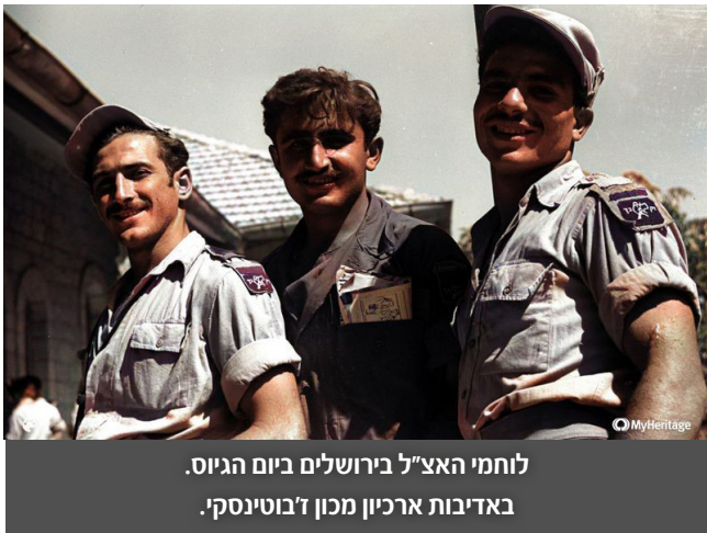
לוחמי האצ"ל בירושלים ביום הגיוס.