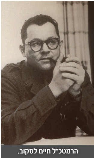
הרמטכ"ל חיים לסקוב.

רבים מהם היו אנשי ארגון ה"הגנה", מיעוטם אנשי האצ"ל ורבים ללא השתייכות ארגונית כזו או אחרת.