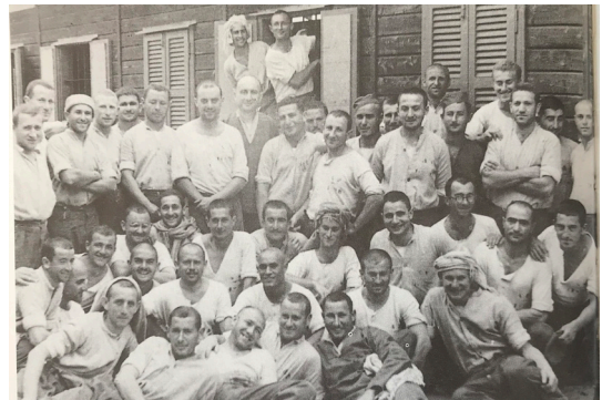
מ"ג אסירי ה"הגנה".