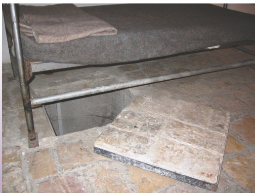
פתח המנהרה בתא 23.