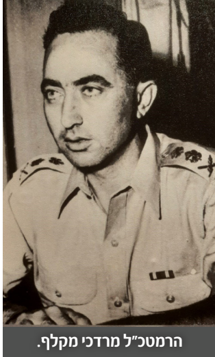
הרמטכ"ל מרדכי מקלף.