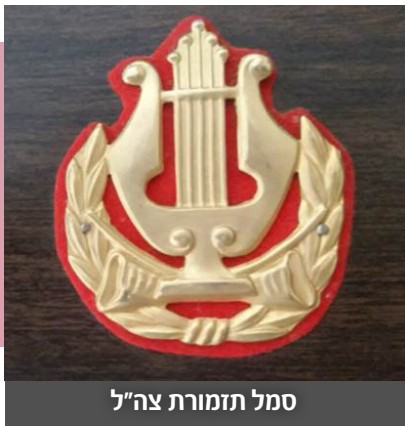
סמל תזמורת צה"ל

במטכ"ל התחילו לדבר על הקמת תזמורת צבאית והדחיפה הסופית להקמת תזמורת צה"ל באה בעקבות ביזיון שקרה ב-18 באוגוסט 1948 בקריה בתל אביב. הציר הסובייטי פאבל יארשוב הגיש את כתב האמנתו לראש ממשלת ישראל דוד בן גוריון. מעברו האחד של השביל המוליך אל הלשכה של בן גוריון עמדה מחלקת שוטרים צבאיים מגוחצים ומצוחצחים שקיבלו את פני האורח ב"דגל 'שקו' ומולם, בבגדים לא מגוחצים ובכלים לא מצוחצחים, עמדה חבורת נגנים מתזמורת שונות. גם הנגינה לא עמדה ברמה משום שהנגנים כמעט ולא עשו חזרות על נגינת ההמונים. מכאן ועד להקמת תזמורת צבאית תקנית הייתה הדרך קצרה ויודעי נגן מכל יחידות צה"ל נקראו להתייצב לבחינה. מובן שגם אני נקראתי לדגל.