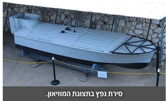
סירת נפץ בתצוגת המוזיאון.

הקמנו את בסיס היחידה בנמל יפו. התקבצו אליה ותיקי 'החוליה', הפלי"ם ויוצאי הצבא הבריטי, קבוצה בת 15 איש [...] נקראתי אל יוסי הראל קצין המנהלה. הוא סיפר לי שנרכשו 6 סירות מהירות, סירות נפץ, שפיתח הצי האיטלקי ושפעלו במלחמת העולם השנייה [...] מתגנבים איתן אל אוניות האויב ובמאה המטרים האחרונים הנוהג בה קופץ החוצה אל המים אל מצוף שמשחרר, והסירה ממשיכה אל מטרתה ומתפוצצת. הרעיון מצא חן בעיניי מאוד [...] וקיבלתי את הפיקוד." (התקופה לקחה אותנו, יוחאי בן-נון, דיוקן, עמ' 58).