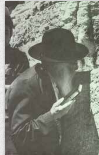
ביקור בכותל המערבי בסמוך לשחרור ירושלים, יוני 1967.

חייו של ר' אריה כפי שהיה מוכר בירושלים, היו קשים. ארבעה מ-11 ילדיו מתו בעודם קטנים, גם ציפּרה-חנה אשתו הייתה על סף המוות ונזקקה לטיפול ממושך. מעולם לא היהודי בארץ, משפחתו כמעט גוועה ברעב. גם כאשר השתפר המצב הכלכלי בארץ, סירב לשפר את תנאי חייו. הוא הוסיף לגור בשני חדרים דלים בדירתו הצנועה שבשכונת משכנות ישראל בירושלים 4 , וכאשר ביקש אחד מאוהביו לקנות לו תנור נפט במתנה כדי לחמם מעט את ביתו בימי החורף הקרים, סירב. כל ימי חייו לא הסכים לקבל מתנה מאיש. את תכלית חייו ראה בעזרה לזולת וידו הייתה פתוחה תמיד לכל מבקש עזרה או עצה ממנו. הכנסת האורחים שלו וטוב ליבו היו לאגדה ושמנו נודע בפי כל כ"צדיק הירושלמי". במיוחד התמסר לאסירים השונים ובעיקר לאסירי המחתרות שישבו בבתי הסוהר הבריטיים בתקופת שלטונם (1917-1948).