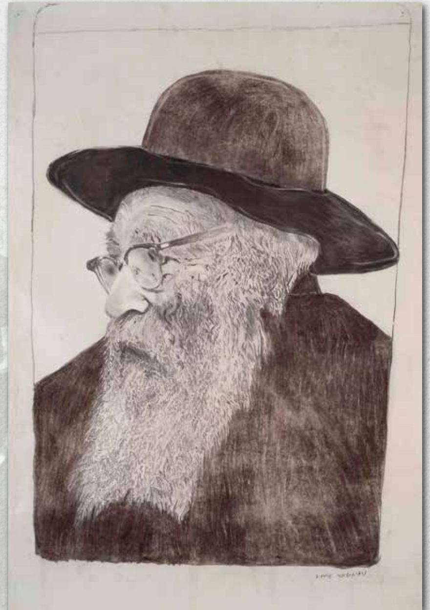
רישום: נעמי גבע-עופר

משנת 1917 ועד יום מותו שימש כמשגיח בתלמוד תורה "עץ חיים" בירושלים ועזר ככל שיכול לבני העניים שבין תלמידיו, אם בקניית נעליים ואם בדמי נסיעה. לא מקרה הוא שאת משכורתו האחרונה תרם להתקנת מערכת ברזים למי שתייה במוסד, כי הילדים סבלו מאוד מחוסר מים. 3