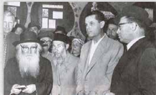
אזכרה ראשונה למשה ברזני ומאיר פיינשטיין בהיכל הגבורה שקדם למוזיאון מימין לשמאל: מנחם בגין, שר בממשלת לוי אשכול ומפקד האצ"ל לשעבר, בנימין פיינשטיין, אחיו של מאיר, הוריו של משה: לולו והמקובל אברהם ברזני, הרב אריה לוי, איתן לבני, יו"ר עמותת אסירי עכו וירושלים, 1968.

בין 11 הפסוקים שקבעו את סדר הקבורה, "וממטה בנימין בגורל" (יהושע כא, ד) כרומז לחלל בנימין בוגלבסקי, "הלוא בן ימיני..." (שמואל א, ט, כא) כרומז לחלל עודד בן ימיני. את הגורל האחרון לא קיימו, כי סדר קביעת החללים הקודמים קבע כבר את זהותו.