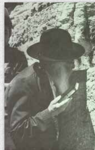
ביקור בכותל המערבי בסמוך לשחרור ירושלים, יוני 1967.

חייו של ר' אריה כפי שהיה מוכר בירושלים, היו קשים. ארבעה מ-11 ילדיו מתו בעודם קטנים, גם ציפּרה-חנה אשתו הייתה על סף המוות ונזקקה לטיפול ממושך. מעולם לא היהודי בארץ, משפחתו כמעט גוועה ברעב. גם כאשר השתפר המצב הכלכלי בארץ, סירב לשפר את תנאי חייו. הוא הוסיף לגור בשני חדרים דלים בדירתו הצנועה שבשכונת משכנות ישראל בירושלים 4 , וכאשר ביקש אחד מאוהביו לקנות לו תנור נפט במתנה כדי לחמם מעט את ביתו בימי החורף הקרים, סירב. כל ימי חייו לא הסכים לקבל מתנה מאיש. את תכלית חייו ראה בעזרה לזולת וידו הייתה פתוחה תמיד לכל מבקש עזרה או עצה ממנו. הכנסת האורחים שלו וטוב ליבו היו לאגדה ושמנו נודע בפי כל כ"צדיק הירושלמי". במיוחד התמסר לאסירים השונים ובעיקר לאסירי המחתרות שישבו בבתי הסוהר הבריטיים בתקופת שלטונם (1917-1948).