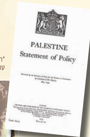
"הספר הלבן של 1939", עמוד הכריכה.

עם תום מלחמת העולם השנייה כשהיה ברור, כי פני הבריטים אינם להקמת מדינה עברית, הוקמה "תנועת המרי העברי" שהיוותה מסגרת גג לשלוש המחתרות. היא פעלה בתיאום במשך כשנה (1945-1946), במטרה לשבש את סדרי הממשל ולקצר את המשך השלטון. לשם כך נעשו פעולות חבלה בנקודות אסטרטגיות כגון מסילות ברזל ("ליל הרכבות", נובמבר 1945) וגשרים ("ליל הגשרים" יוני 1946). פיצוץ מלון "המלך דוד" בירושלים (יולי 1946) הצית שוב את חילוקי הדעות בין המחתרות והביא לפירוק שיתוף הפעולה. שלוש המחתרות המשיכו לפעול כנגד הבריטים באופן נפרד עד להקמת צה"ל.