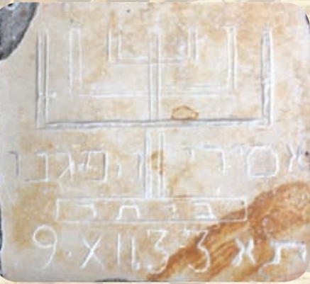
חריטה עם כיתוב, אסירי הפגנ(ת) ביתר תל אביב (תא) 9 דצמבר 1933.

"אסירות ועצירות בית לחם" (20-21) - תיאור פועלן של לוחמות המחותרות וכליאתן בבית הסוהר והמעצר בבית לחם.