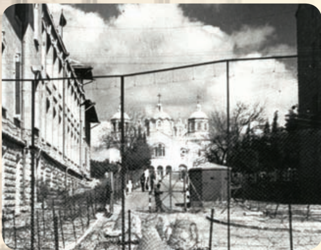
ביצורים בכניסה ל"בווינגרד", 1947-1948.

בנובמבר 1917, מספר שבועות לפני שכבשו את הארץ פרסמו הבריטים את "הצהרת בלפור" שלפיה יוקם "בית לאומי לעם היהודי בארץ-ישראל". למרות ניסוחה המעורפל, נטעה ההצהרה תקוות רבות בקרב יהדות העולם והיישוב היהודי בארץ-ישראל. כיבוש הארץ על-ידי הבריטים בשלהי מלחמת העולם הראשונה (1917-1918), הביא לסיומן של 400 שנות שלטון עות'מאני שהפך מושחת ונחשל והתנגד לפעילות הציונית בארץ. הבריטים כוננו בארץ שלטון צבאי שבתחילת