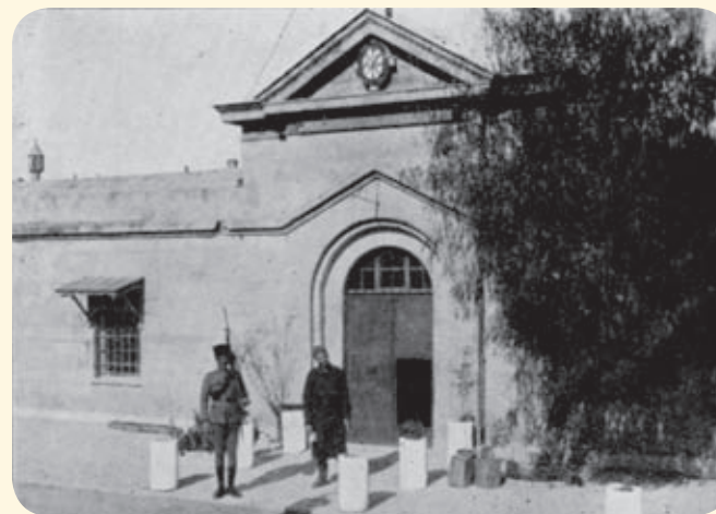
הכניסה לבית הסוהר.

בשלהי מלחמת העולם הראשונה (1917) כבשו הבריטים את הארץ מידי העות'מאנים ושלטו בה במסגרת המנדט ועד 1948. בתקופה זו הפך המתחם למרכז שלטוני-ביטחוני בריטי שנודע בכינויו "בווינגרד". אכסניית הנשים הוסבה לבית הסוהר המרכזי הבריטי, בו נכלאו לאורך השנים לצד אסירים פליליים ערביים ויהודים גם מאות מלוחמי המחתרות - ה"הגנה", האצ"ל ולח"י.