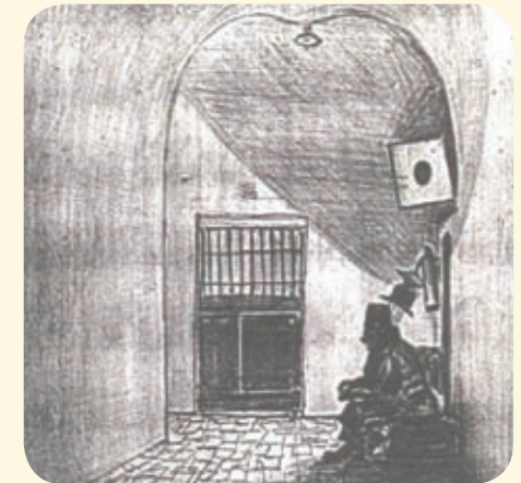
"סוהר בעת שמירה"

מספרי החדרים המצוינים במסלול ובמפה שבכריכת החוברת, מופיעים מעל לפתח החדר.