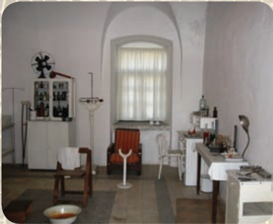
מרפאת הכלא, שחזור.

של מנהל הכלא וחדר המזכירות הסמוך לו הופרדו בקיר חוסם (לא שוחזר), הכניסה אליהם הייתה מבחוץ. על המדפים משמאל לדלת מוצגים חפצים משוחזרים שבאמצעותם הבריחו האסירים חומרים אסורים אל הכלא וממנו, וכן חפצים אסורים, שנתפסו בחיפוש בתאי האסירים.