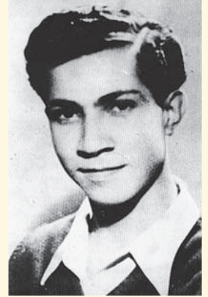
עולי הגרדום משה ברזני (1926-1947) ומאיר פיינשטיין (1927-1947).