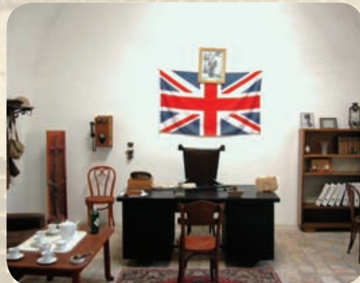
חדר מנהל הכלא, שחזור.

שכנו בפי האסירים "גיהינום" נכלאו אסירים שעברו על חוקי הכלא, כמו השתתפות בקטטה, או התחצפות לסוהר. עונש המאסר בצינוק ניתן על ידי מנהל הכלא והוא נע בין שעות ספורות לשבועיים.