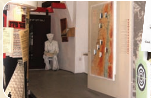
סוהר, תערוכת "תקוות ואכזבות".