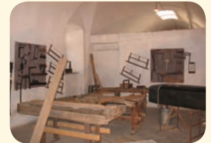
נגריית בית הכלא המרכזי, שחזור.

המלאכה כחלק משגרת היום. בין בתי המלאכה היו נגרייה, דפוס, סנדלרייה ומתפרה בה ארגו האסירים בורשים לשינה ותפרו מדים. הבריטים השתמשו בבתי המלאכה גם לצרכים חיצוניים דוגמת הדפסות בבית הדפוס, או הכנת ארונות קבורה לחיילים ושוטרים בריטיים בנגרייה.